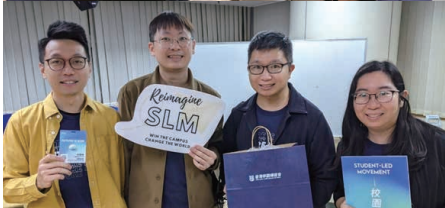
上：新領袖團隊答問環節