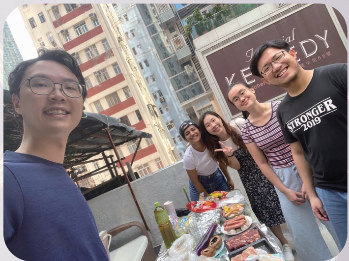
22-23 服侍國際生的同工團隊

Like me, many international students come