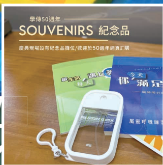
協助設計 50 週年紀念品