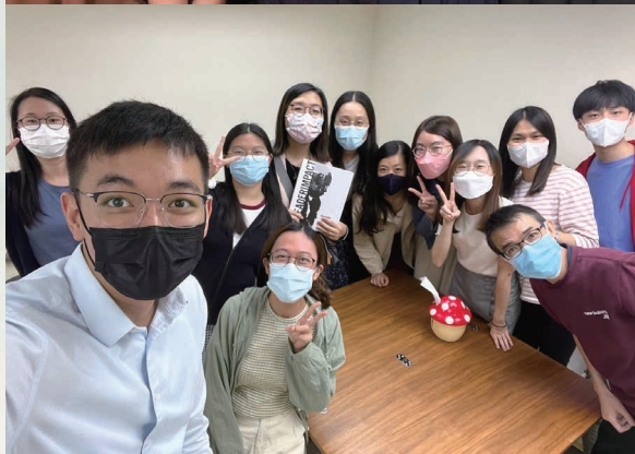
上：理大學傳的日子 下：Foundations 小組

相比學生時期，職場生活並沒有固定的基督徒群體，有不少感覺孤單的時候。工作佔了我生活大部分的時間，要刻意把時間分別出來靈修禱告變得困難；在輪班的工作節奏中，生活上增加了很多限制，返教會也不再是必然的事。另外，當某一陣子工作特別忙碌，迷失的思緒便會突然出現，大大影響生命狀態：懷疑自己的能力是否能勝任，不清楚自己是否應該繼續承擔這份工作。我曾經很想逃離這種生活，因為覺得自己已耗費太多心力面對工作帶來的情緒，好像自責、灰心，還覺得工作令自己「殘了」很多。然而，當我經歷越工作越沒有方向時，卻因着不同的小組和群體，逐漸意識到與別人建立適當界線的重要性——不要把自己放得太大，也不要把別人的期望，不知不覺地轉變為批判自己或論斷別人的準則。