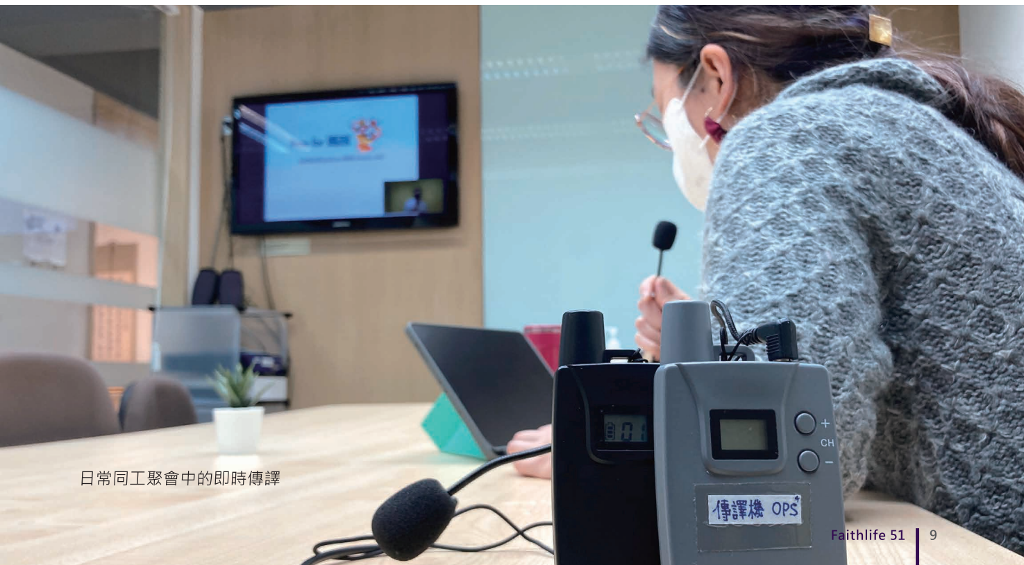
日常同工聚會中的即時傳譯

非常感恩，天父真是聽禱告的神，在造就、傳福音的過程中，祂親自呼召人回應這個禾場的需要，讓我們今年可以迎來兩位非本地同工的加入！