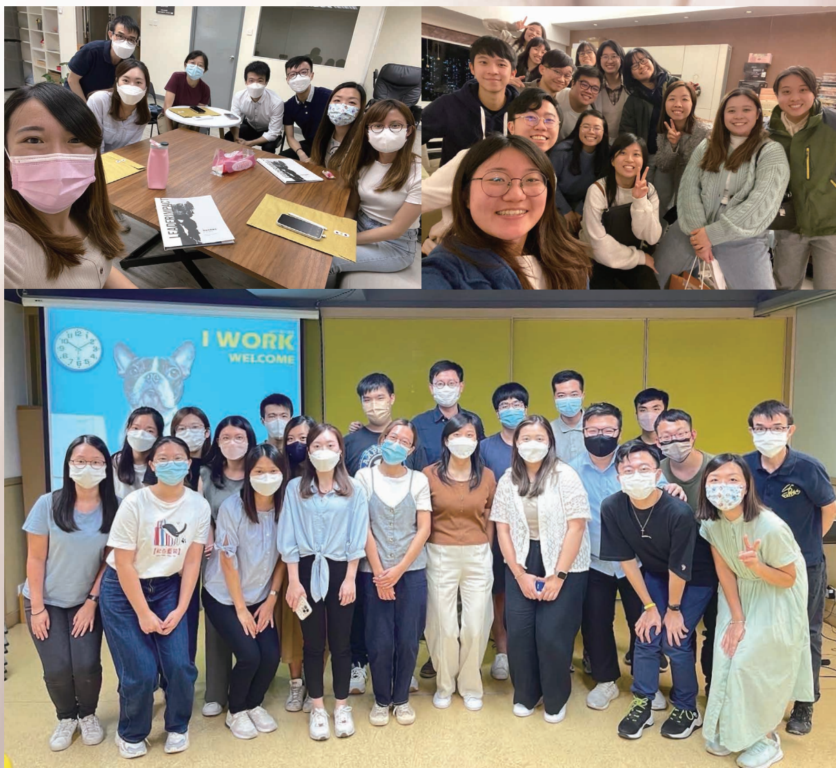
上左：LeaderImpact Foundations 小組；上右：科大畢業生的聚會 下：職場火種聚會

新手媽媽不時會感到迷惘和不懂如何處理初生嬰兒的需要。感恩神讓我這幾個月可以藉懷孕前後和照顧初生孩子的經歷，向同樣作為新手媽媽的畢業生和職場門徒分享、彼此代禱，即使遠在英國、加拿大的門徒都可以用「Zoom」和訊息分享需要。神幫助我在媽媽和半職服侍中能作更好的時間分配，並且更深經歷彼此代禱守望的重要。●