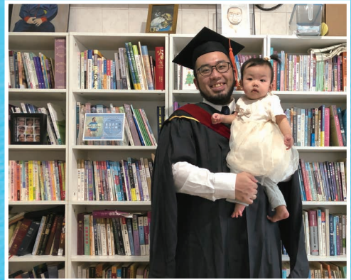
保焜同工 22 年於中神道碩畢業

在讀神學前，我已在學傳差傳事工部事奉多年，過程中慢慢發現自己對研究和教育類的工作有負擔，例如宣教教育、宣教研究和宣教士培訓等。因為當時學傳未有設立研究部門，我便決定離職入讀神學，不用滿足畢業後需留在機構兩年的要求，期望能更開放地探索自己的前路。