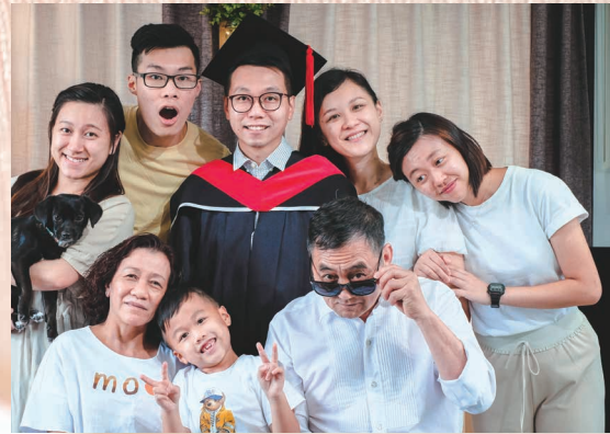
道學碩士畢業家庭相

修讀神學讓我有機會接受裝備，但我認為讀神學不單為了增進知識和滿足理性，而是希望更「落地」協助前線的服侍者和事工。故此，相比過往，今天我會更着意思考神學如何能更好地支援前線，包括重新檢視一些約定俗成的事工哲理，例如對福音的詮釋、事工成功的定義、門徒的召命等。再者，對於前線事奉例如宣講教導、門徒造就和靈命塑造等，也盼望透過傳遞神學基礎，提供更深度的根據和支持。當然，「更新」並非意味着要推倒所有傳統，而是將「舊事」重塑以回應不同的處境。為此，我的心情既期待又戰兢，期待看見神學反省能加強機構的深度，至於在更新過程中如何秉持重要的「柱石」，則需要從神而來的智慧去分辨。