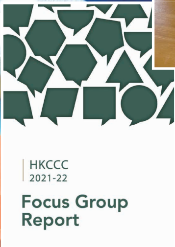
焦點小組及問卷調查報告

當你想到「學傳」，腦海會自然地出現一系列的感和想法，這就是「品牌效應」。生活在 2023 年的今天，我們吸收資訊的方式非常多樣，認識學傳的場景亦不再獨限於親身參與，你閱讀這篇文章的平台（可能是 FaithLife、IG/Facebook 或網頁）、我們的標誌 Logo 和產品、網頁所用的顏色、文章的措詞等，每一項均影響着受眾對學傳的印象，而且有不少部份是在潛意識中接收的。隨着環境的轉變，我們不斷嘗試以各樣方式實踐不變的召命，不同受眾對我們的印象，均受其學生年代學傳展現的形象所影響。因此為了讓大眾能更準確地認識到今天的學傳，我們於 2021 年中成立了這個部門，嘗試逐步更新核心事工活動以外能讓人連結到「香港學園傳道會」的事物，小至一個禮品袋，大至網頁及社交平台的營運，皆渴望讓我們的受眾更準確地認識我們。