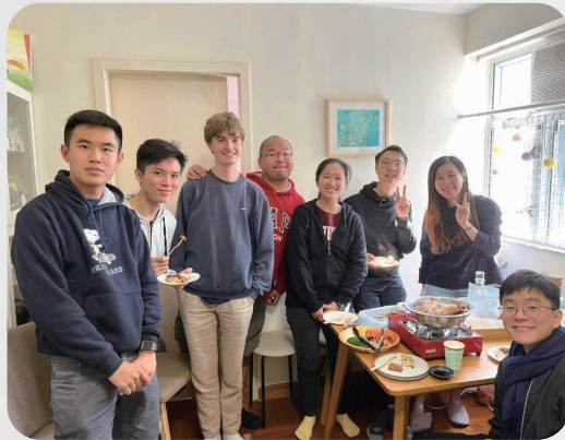
新年以盆菜款待港大國際生

解，甚至與她一起拆解原生家庭、文化經驗如何成就今天的她，再一同嘗試用屬天的眼光重建生命，盼望她能健康地以作為一個人，而非一件物件或機器，來回應如此多變的世代！●