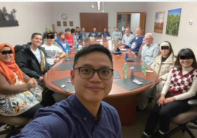
LeaderImpact Next 留學生聖誕節聚會

加拿大有五個時區，我曾去過三個省和幾個最大的城市，所有我認識在加的香港人都認同，沒有任何一個城市像香港那麼繁華。來到這裏最大的適應當然是掛念在港的家人和朋友，其次就是面對寒冷的冬天，孤單感總不時湧上心頭，但這對我這位性情外向的人而言，更多是提供了磨練內在生命的場景。若問我最感恩的事，莫過於能遇上很多無私及樂於助人的香港人，並從他們身上學習很多生存技能，例如家居維修、應對極端天氣和環境等。另外，在這裏也可以接觸不同國籍的留學生和新移民，體驗多元文化，學習不同的語言和生活習慣。